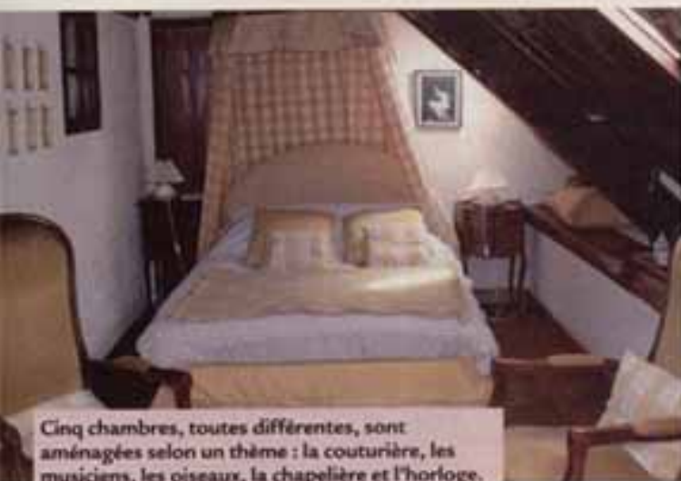
Cinq chambres, toutes différentes, sont aménagées selon un thème : la couturière, les musiciens, les oiseaux, la chapelière et l'horloge.